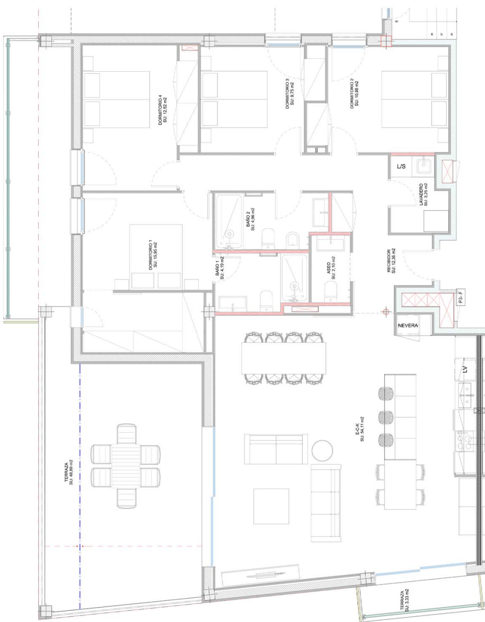
VIVIENDA TIPO 8.1 LUD P3.F